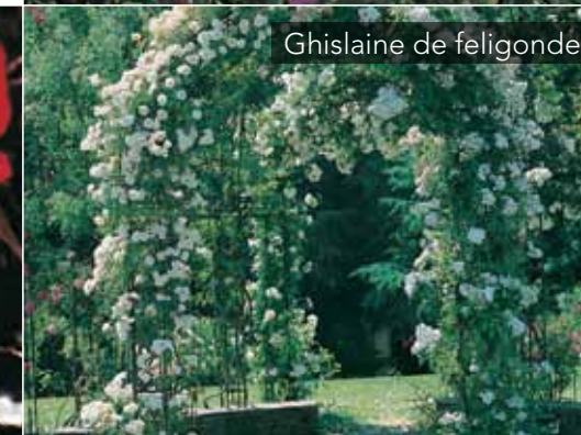
Ghislaine de feligonde